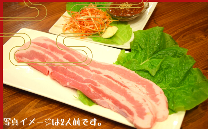
写真イメージは2人前です。